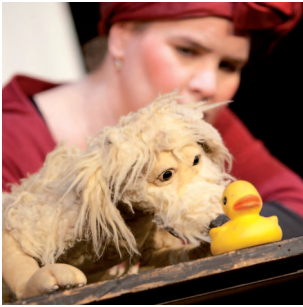
23.10.2012: Der kleine gelbe Hund | Premiere Puppentheater Landestheater Altenburg | Heizhaus

Eines Morgens ist er einfach da und winselt: Ein kleiner heimatloser Hund sitzt vor der Haustür von Mona. Draußen ist ein Hundewetter und so nimmt Mona das tropfnasse Tier zu sich ins warme Haus. Sie beschließt, dass der Hund ein wenig bei ihr bleiben darf, aber nur vorübergehend, denn sie will in Ruhe arbeiten. Mona ist Malerin und ihre Lieblingsfarbe ist grau: blaugrau, grüngrau, steingrau, grau grau... Der kleine Hund findet grau ziemlich langweilig und von Ruhe hält er gar nichts, er möchte lieber spielen. So stellt er den Alltag der Malerin ganz schön auf den Kopf: er steckt seine Nase überall hinein, in Kochtöpfe, Farbtuben und natürlich auch auf den verstaubten Dachboden. Beim Stöbern entdeckt er dort ein Geheimnis der Malerin...