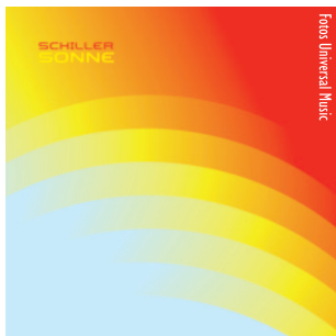
Schiller | Sonne Elektro-Pop

Der Meister des Global Pop, Christopher von Deylen, entwirft in 30 Songs einen opulenten Klangkosmos, internationale Gaststars geben dem brandneuen Album seiner Band Schiller ihre ganz persönliche Stimme. Der Graf von „Unheilig“ singt den kraftvollen Titelsong „Sonne“ und der amerikanische Elektronik-Künstler Owl City das poppige „Alive“.