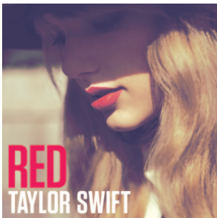
Taylor Swift | Red Pop

Sonne erscheint am 05.10.2012 bei Island | Universal Music