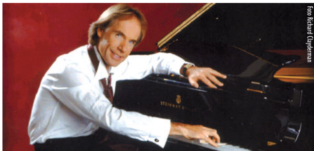
Foto Richard Clayderman

Weltweite Berühmtheit erlangte der „Prince of Romance“ - wie er von Nancy Reagan genannt wurde - durch die „Ballade pour Adeline“. Die Single verkaufte sich in 38 Staaten über 22 Millionen mal.